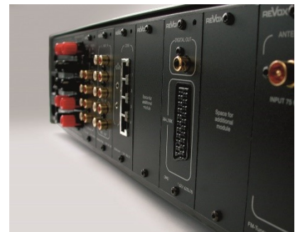
Revox M51 Modulslots