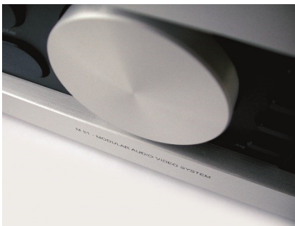
Revox M51 Detail

Die Leitidee der Modularität findet sich auch in zwei unterschiedlichen Endstufenkonzepten verwirklicht. Zur Auswahl steht die Ausstattung mit einer analogen 5 x 60 Watt Endstufe und eine 5 x 200 Watt PWM Endstufe für besonders große Räume.