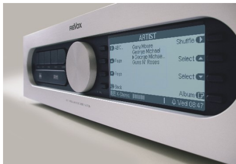
Revox M51 Display