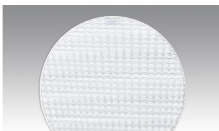
Revox Inceiling I82