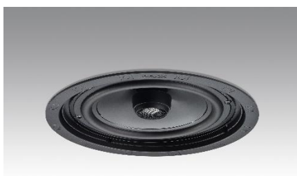
Revox Inceiling I82 ohne Abdeckung