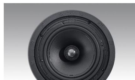
Revox Inceiling I82 ohne Abdeckung