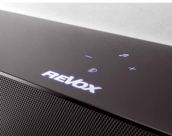
Unter der Oberfläche aus Glas befinden sich berührungssensible Tasten für die Bedienung der S100 Audiobar