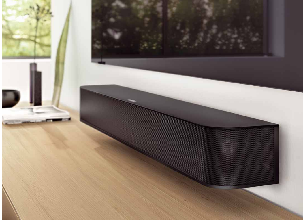
Elegantes Design, hochwertige Verarbeitungsqualität, einfache Bedienung, vollwertige Ausstattung und vor allem: erstklassige Klangqualität bei der Revox Studioart S100 Audiobar!

Praxis Wahlweise lässt sich die Studioart S100 Audiobar unter einem TV-Gerät auf einem Rack oder an der Wand befestigen, die passenden Wandhalter sind bereits im Lieferumfang enthalten. Beim Setup der S100 lässt sich zudem die Aufstellungsart (wandnah, freie Aufstellung oder Wandmontage) anwählen, die Software nimmt dann entsprechende Klangeinstellungen vor. Zusätzlich sind Bass- und Höhenanteile individuell regelbar, außerdem bietet die Revox S100 Audiobar einen Modus für extraweite Klangwiedergabe, die erstaunlich gut funktioniert und eine beachtlich breite Soundbühne produziert. In der Tat lässt sich mit der S100 und der Soundeinstellung „X-Wide“ ein verblüffend räumliches Kinosound-Erlebnis