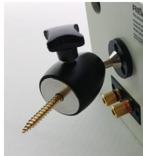
Wandhalterung Piccolo S60