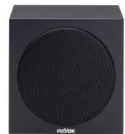
Revox Piccolo S60 schwarz