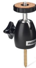
Wandhalterung Piccolo S60